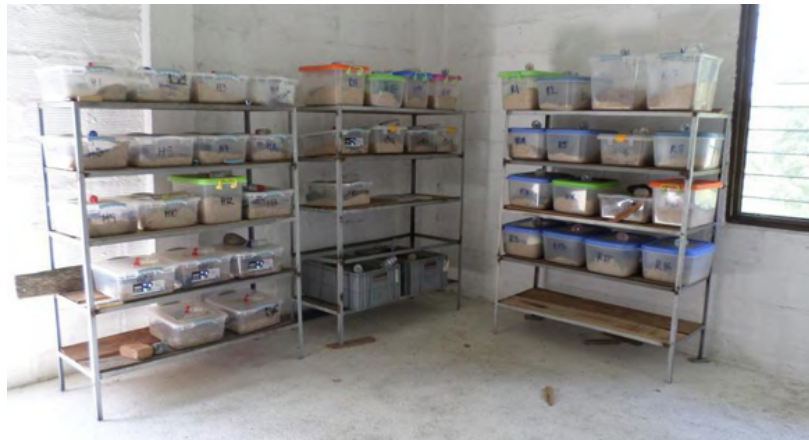
Fotografía 9. Cajas para animales de Bioterio.

Bioterio. En este lugar está ubicada la producción de ratones, hámster y tenebrios para suplir la necesidad alimentaria de los animales que lo requieran.