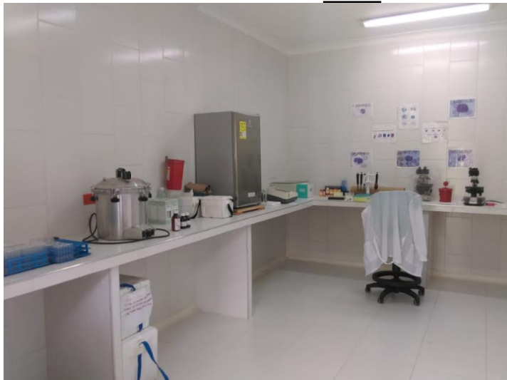
Fotografía 4. Laboratorio.

Jaulas y bloques de permanecia de los animales. En estos lugares se da albergue a los animales que llegan al CAV y una vez la respectiva recepción, atención y valoración. Este albergue es utilizado si es imposible la liberación, reubicación inmediata o mientras se espera su decisión de destino final ideal.