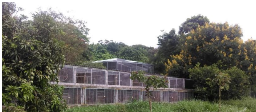
Fotografía 5. Bloques de jaulas de mantenimiento.

Jaulas y bloques de permanecia de los animales. En estos lugares se da albergue a los animales que llegan al CAV y una vez la respectiva recepción, atención y valoración. Este albergue es utilizado si es imposible la liberación, reubicación inmediata o mientras se espera su decisión de destino final ideal.