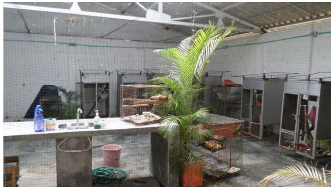
Fotografía 1. Área de recepción de animales.

Área de recepción y/o cuarentena. Zona dispuesta con jaulas listas para el ingreso de nuevos animales, y así cumplir en lo mejor posible un tiempo de cuarentena que depende de cada especie.