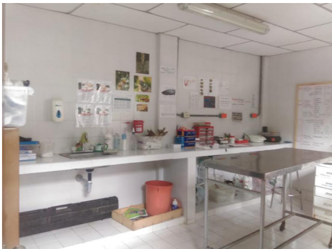
Fotografía 2. Área clínica, primera valoración y atención de animales que ingresan al CAV.

Clínica de recepción y tratamiento. Este es el primer lugar donde llega el animal, para ser revisado clínica, biológica y zootécnicamente, aquí se toma los datos y se instaure un diagnóstico inicial y un tratamiento si es necesario.