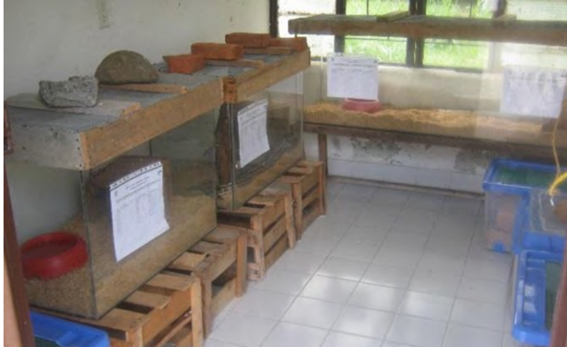
Fotografía 7. Acuarios para serpientes.

Área de manutención de anfibios: el área contempla la regulación de la temperatura, de la luz y de la humedad de manera automática, por lo que el seguimiento de las condiciones ambientales de los anfibios se realizan con un estricto acompañamiento a las variaciones de los recintos.