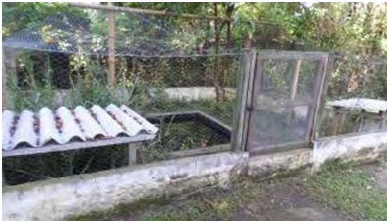
Fotografía 6. Jaulas de tortugas acuáticas.