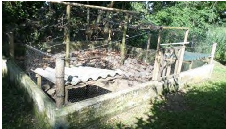
Fotografía 7. Bloques de jaulas de mantenimiento.

Cocina. Lugar exclusivo para preparar y almacenar todas las dietas de los animales, las dietas especiales, enriquecimientos alimenticios. Este lugar debe estar siempre limpio y ordenado.