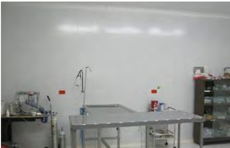
Fotografía 3. Quirófano.

Quirófano y laboratorio. El CAV cuenta con Área de Laboratorio para procesar muestras como apoyo diagnóstico en caso de una enfermedad; Cuenta con un quirófano, un equipo de anestesia inhalada, donde se realizan cirugías y procedimientos que requieran sedar y anestesiarse al paciente.