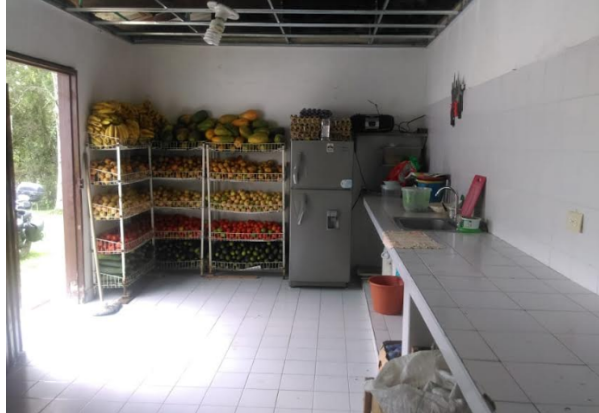
Fotografía 8. Cocina

Bioterio. En este lugar está ubicada la producción de ratones, hámster y tenebrios para suplir la necesidad alimentaria de los animales que lo requieran.