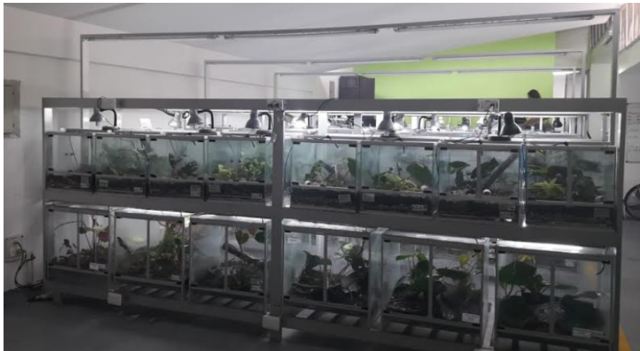
Fotografía 7. Bloques de jaulas de mantenimiento de anfibios.

Área de manutención de anfibios: el área contempla la regulación de la temperatura, de la luz y de la humedad de manera automática, por lo que el seguimiento de las condiciones ambientales de los anfibios se realizan con un estricto acompañamiento a las variaciones de los recintos.